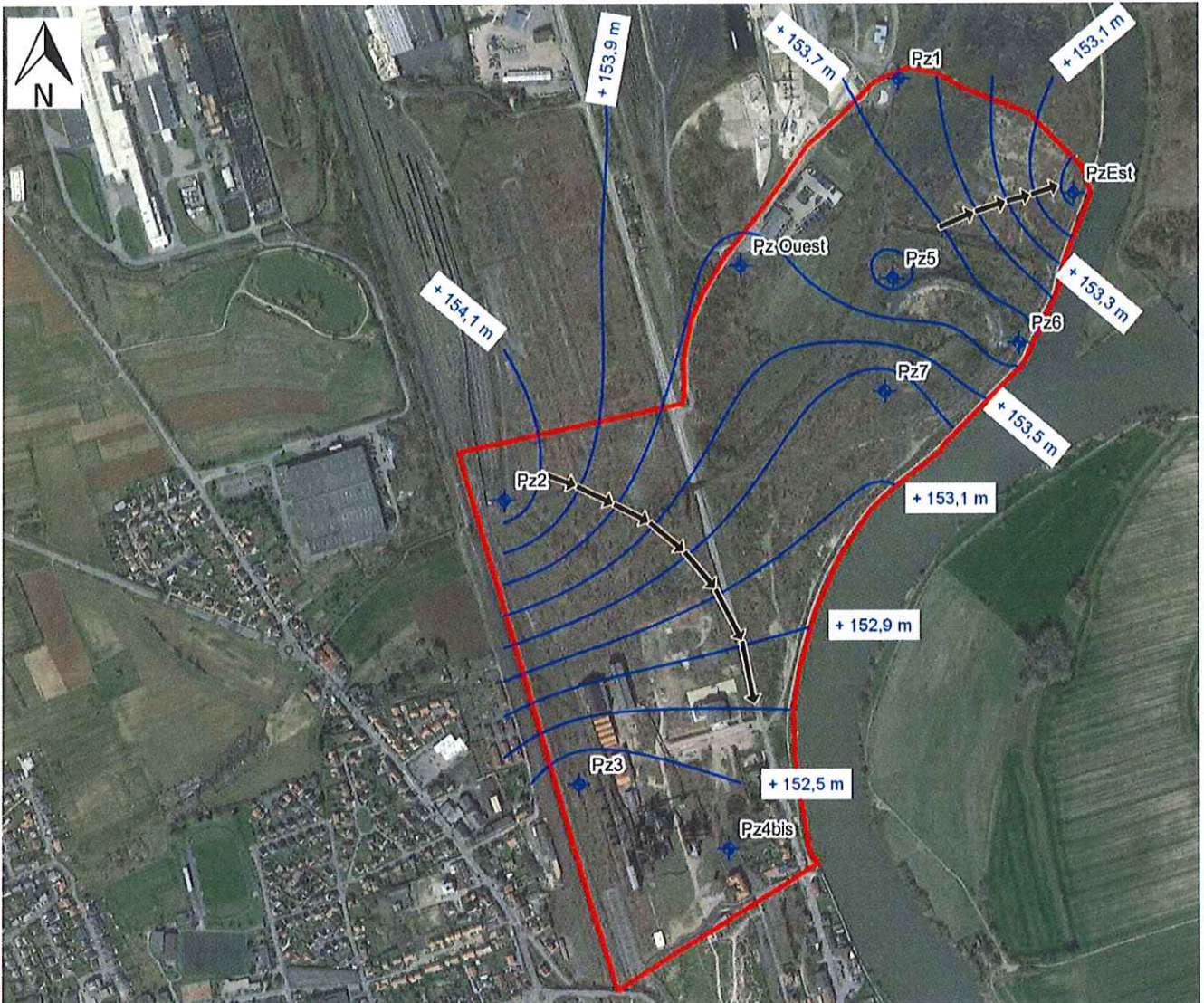
Figure 1: Implantation des piézomètres

PREFECTURE DE LA MOSELLE du pour être annexé à mon arrêté n° DCAT/BEPE/N° 199 du 27 SEP. 2022